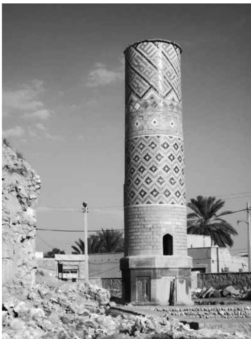
مناره شیخ دانیال

Teixeira, Pedro. kings of Hormuz , translated by W.F. Sinclair, London: 1958.